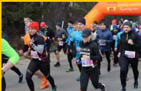
Wystartowała „Aktywna Piątka Gminy Łomża” (s. 16-17)