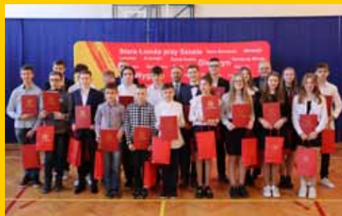
Stypendia dla najlepszych uczniów (s. 18-19)