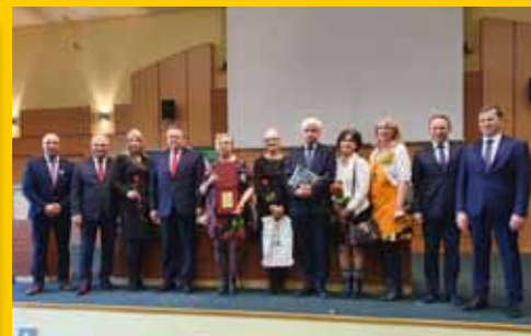
Dzień soltysa z odznaczeniami (s. 10)