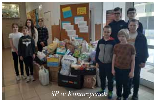
SP w Konarzycach

Wysłaliśmy wiadomość do deputowanego Volodymyra Pohadaieva. Odpowiedział podziękowaniem.