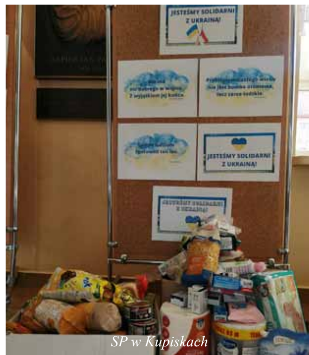
SP w Kupiskach

Numer PESEL nadajemy w pokojach nr 6 i 7, od poniedziałku do piątku, w godz. 10-14.