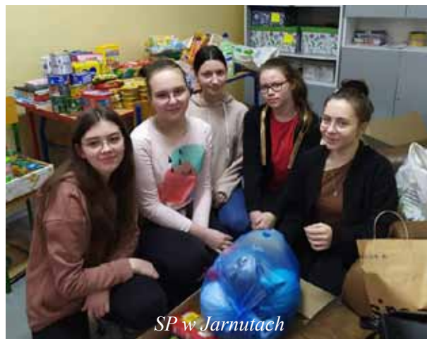
SP w Jarnutach